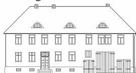
Alte Pfarrei Niederuff 34596 Bad Zwosten

Die Alte Pfarrei ist Mitglied im Kulturnetzwerk Landrosinen